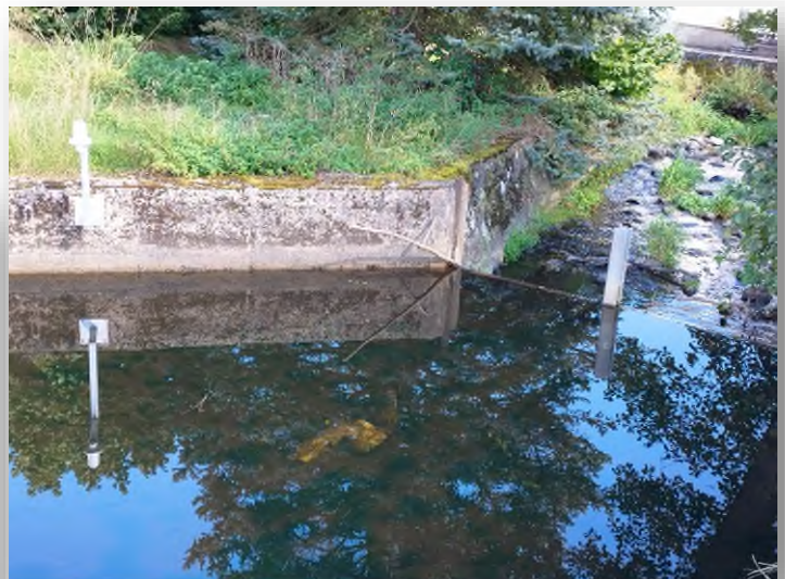
Installation Starkregenfrühwarnsystem im Sommer 2023