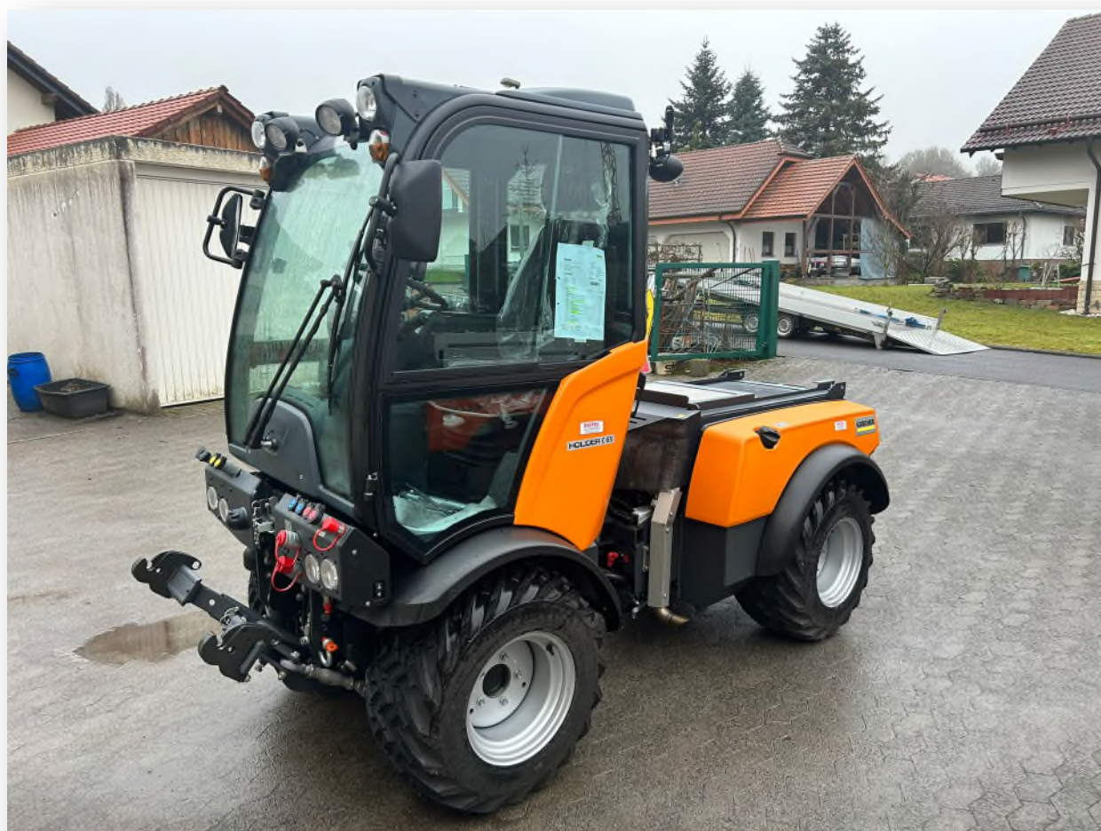
Das neue Mehrzweckfahrzeug HOLDER vom gemeindlichen Bauhof Auslieferung und Inbetriebnahme im Dezember 2023