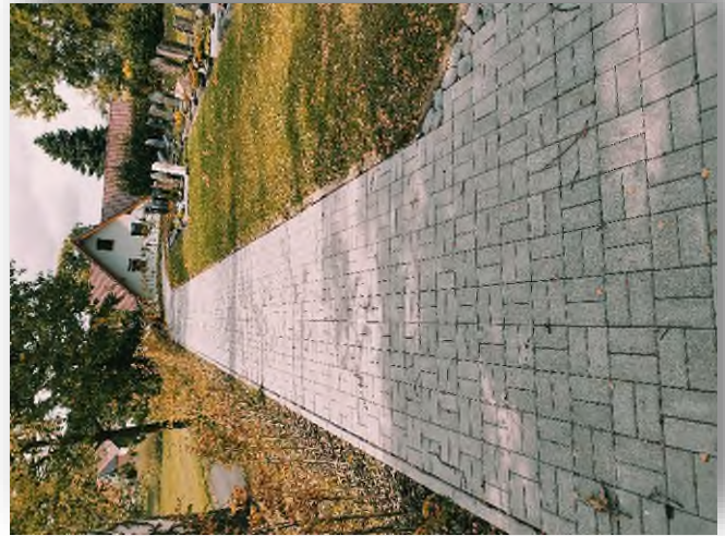
Umgestaltung Friedhof Schletzenhausen mit neuen Urnensammelgräbern