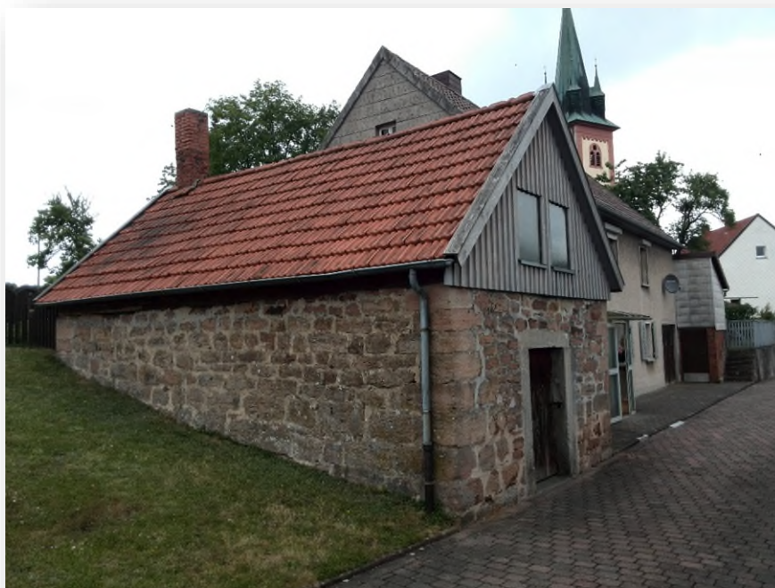
Backhaus „An der Kirche“ in Hosenfeld